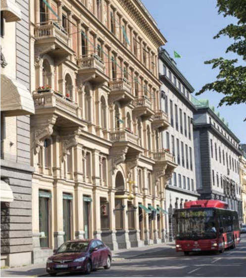
Eugenia von außen mit Buchhandel und Café

Menschen außerhalb der Kirche, die in Kultur, Kunst, Museen und Literatur tätig sind.“ Und er versucht auch hier zu übersetzen und diese Menschen in die pastorale Arbeit einzubinden: „Architektonisch interessant ist unser Kirchplatz, der zwischen Eingangsbereich und Kirche liegt. Ein Treffpunkt im Dazwischen. Das war vermutlich nicht so geplant, hat aber eine symbolische Bedeutung.“