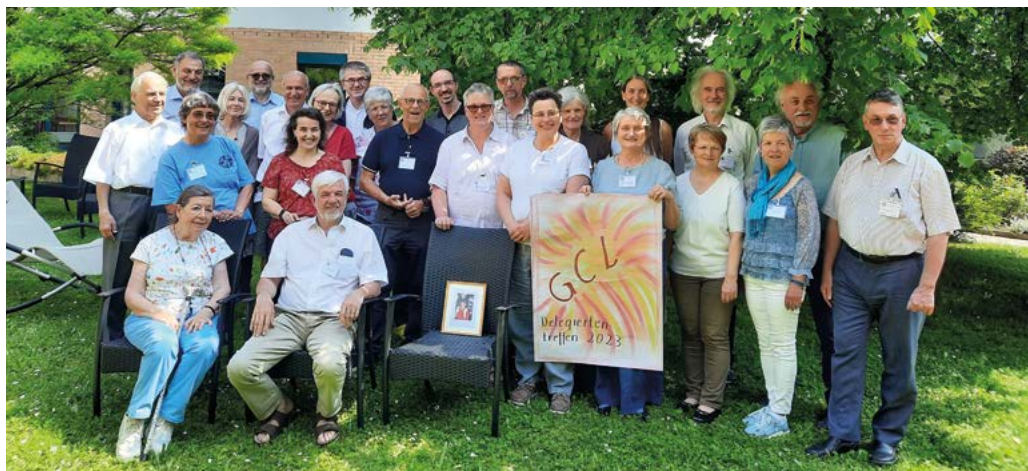
Österreichisches Delegiertentreffen 2023 in St. Pölten

Wer immer in die GCL-Österreich aufgenommen wird, ist gleichzeitig auch Mitglied der GCL-Weltgemeinschaft.