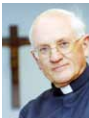
PATER EBERHARD VON GEMMINGEN SJ