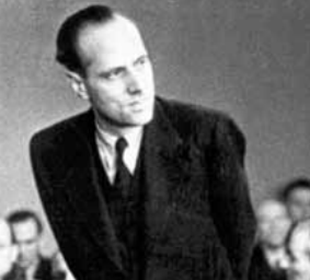
Helmuth James Graf von Moltke