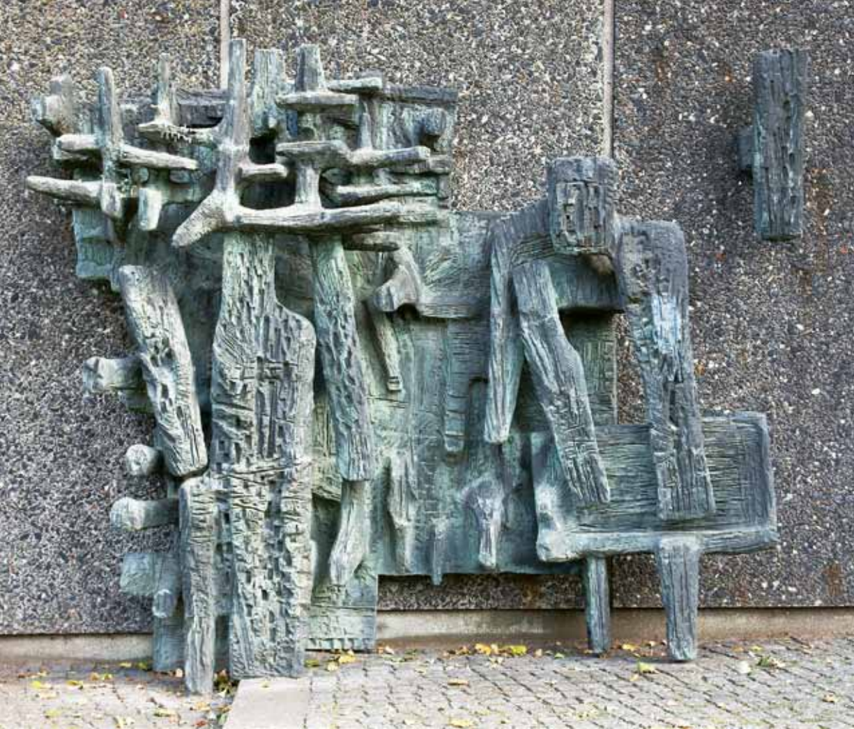
Station aus dem Kreuzweg im Hof von Maria Regina Martyrum: Jesus vor Pontius Pilatus