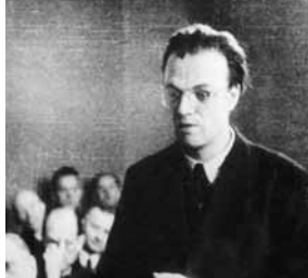
Alfred Delp SJ