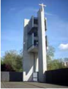
Titelbild: Turm von Maria Regina Martyrium