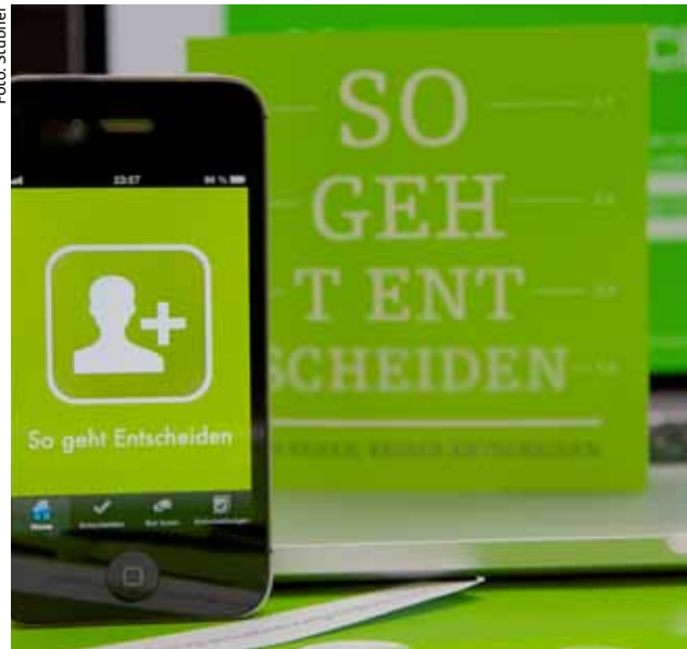
Smartphone, Booklet und PC

rufungspastoral ab Herbst das „Mind & Soul“-Projekt an. Ein Jahr lang leben die Teilnehmer in einer eigenen Wohnung in unmittelbarer Nähe zur Hochschule für Philosophie in München. Sie studieren Philosophie und lernen im Kontakt mit Jesuiten den Orden und seine Spiritualität kennen, um so klären zu können, ob Jesuit sein auch ihr Weg werden könnte.