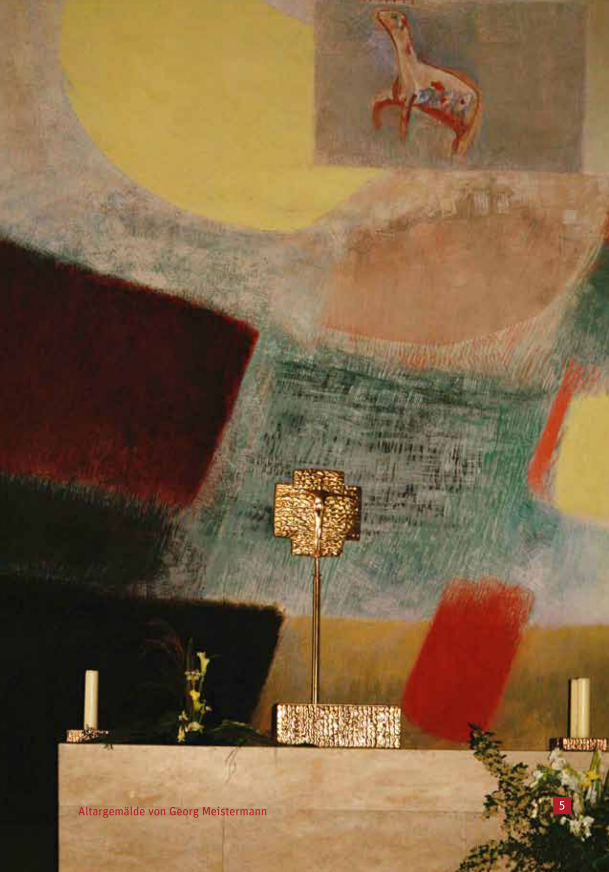
Altargemälde von Georg Meistermann