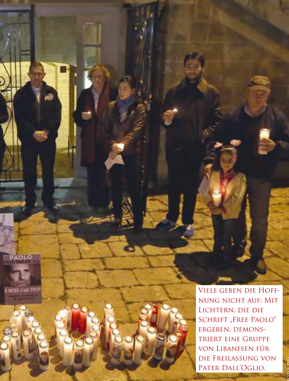
VIELE GEBEN DIE HOFFNUNG NICHT AUF: MIT LICHTERN, DIE DIE SCHRIFT „FREE PAOLO“ ERGEBEN, DEMONSTRIERT EINE GRUPPE VON LIBANESEN FÜR DIE FREILASSUNG VON PATER DALL'OGGIO.