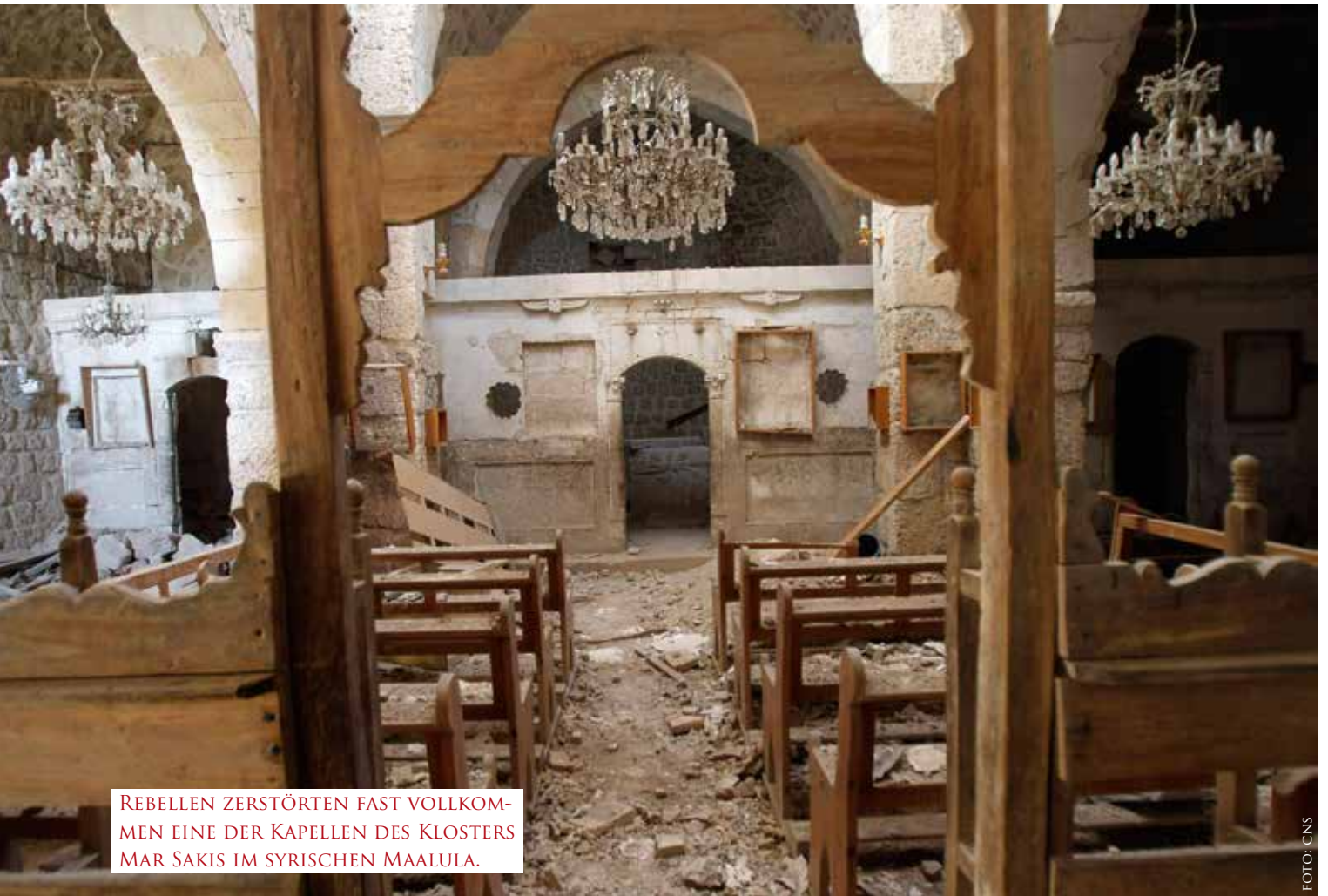
REBELLEN ZERSTÖRTEN FAST VOLLKOMMEN EINE DER KAPELLEN DES KLOSTERS MAR SAKIS IM SYRISCHEN MAALULA.